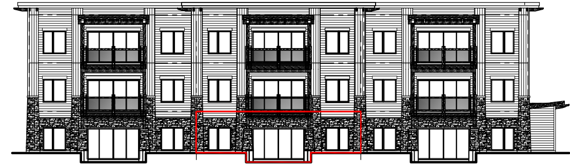
FAÇADE DU BÂTIMENT