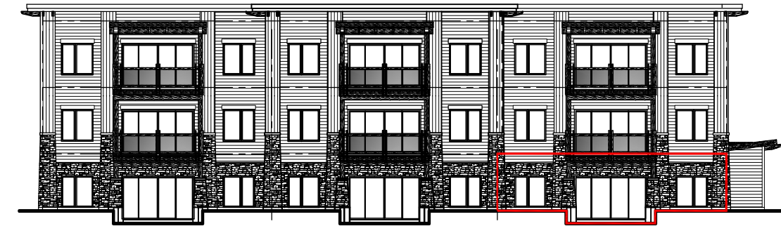
FAÇADE DU BÂTIMENT