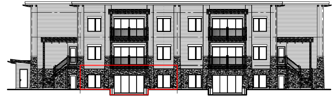
ÉLÉVATION ARRIÈRE DU BÂTIMENT