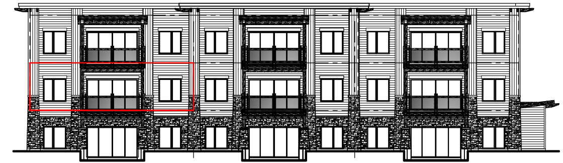
FAÇADE DU BÂTIMENT