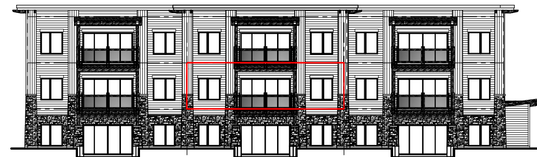
FAÇADE DU BÂTIMENT