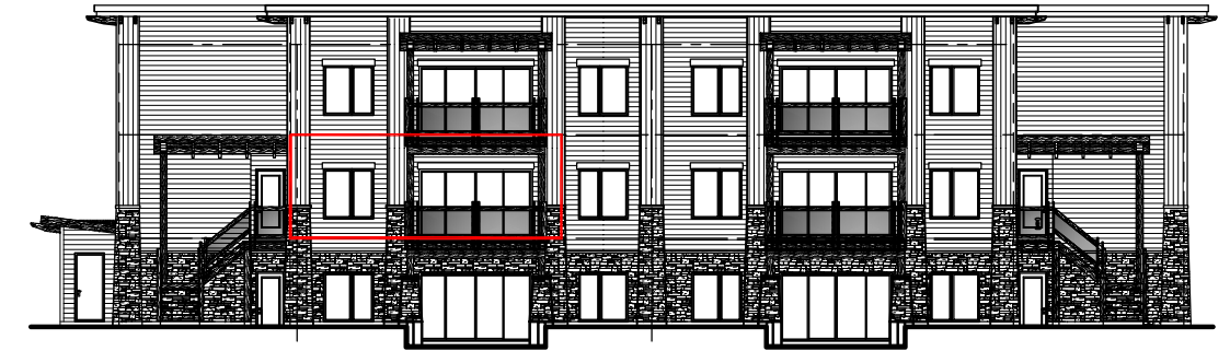
ÉLÉVATION ARRIÈRE DU BÂTIMENT