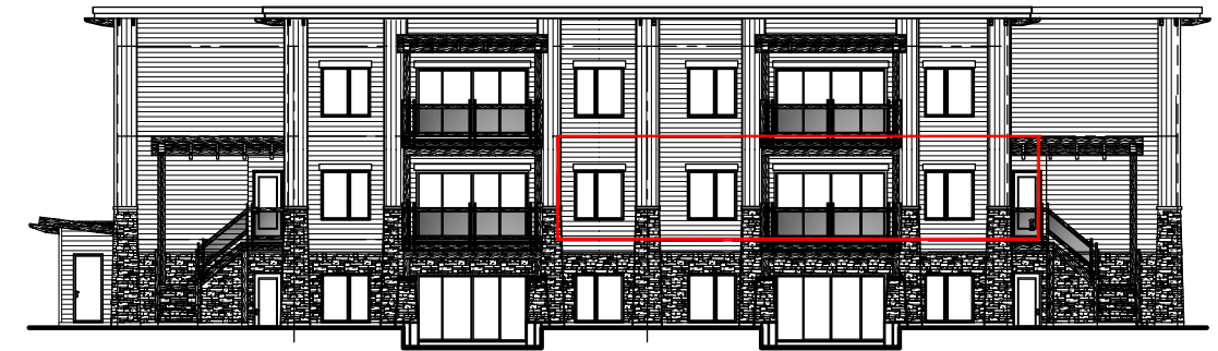
ÉLÉVATION ARRIÈRE DU BÂTIMENT